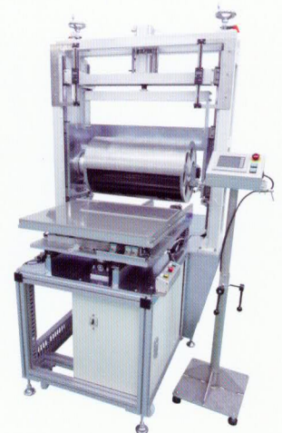
HR-E500T 手動剥離タイプ(補正なし) HR-E500T manual removal type (no compensation)